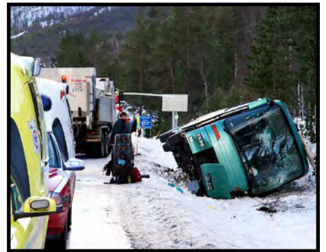
VELTET: En buss med 41 passasjerer om bord veltet tirsdag morgen på riksvei 3 i Sør-Trøndelag.